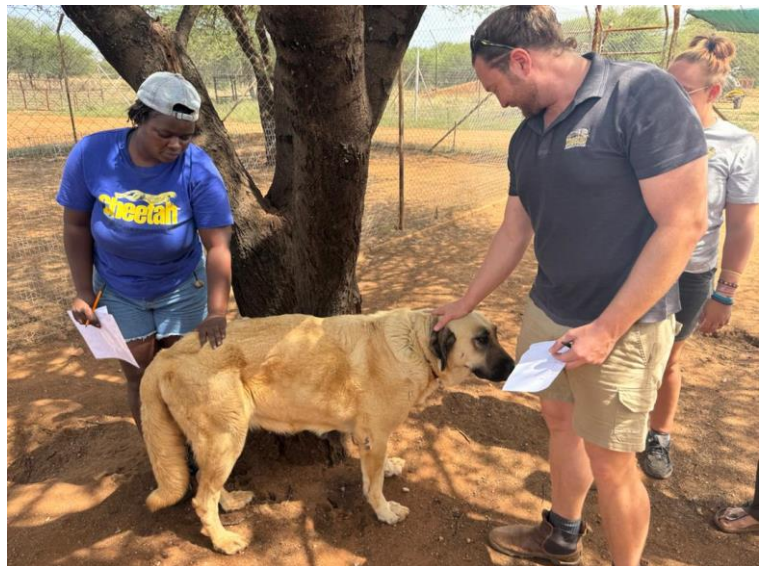
Neben den wichtigen Untersuchungen ist auch Zeit für ein paar extra Streicheleinheiten.

Egal ob Kangal oder Mischlingshund, eines haben beide gemeinsam: Nur gesunde Hunde sind glückliche Hunde und nur glückliche Hunde können ihren wichtigen Beitrag zum Gepardenschutz leisten. Die Verantwortung endet für uns daher nicht, wenn die Hunde in ihr neues Zuhause auf den Farmen ziehen. Da es ein wichtiger Teil des Projektes ist, die Hunde so gesund wie möglich zu halten, führt das Team jährliche Gesundheitschecks bei allen Hunden durch. Auch auf den Ernährungszustand wird bei diesen Checks viel Wert gelegt. Die Tiere müssen ausreichend und artgerecht ernährt werden und sich in einem für ihre Aufgabe optimalen Zustand befinden.