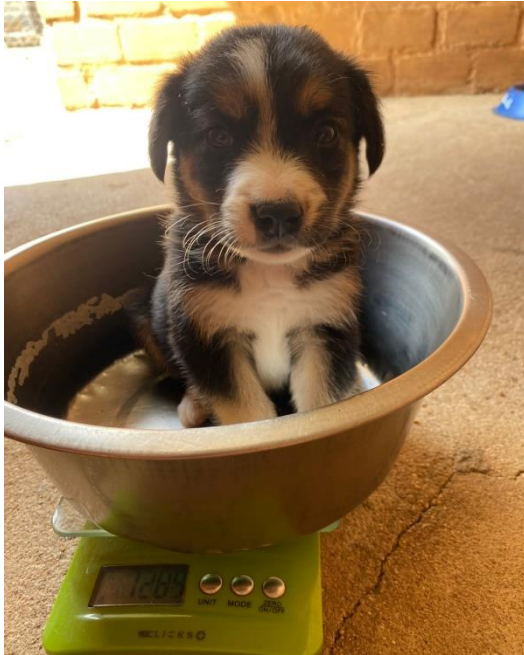
Auch dieser kleine Mischling wird einmal ein Herdenschutzhund.

Auch wenn die Kangals weiterhin die Stars in unserem Herdenschutzhundeprojekt sind, zeigen die Mischlingshunde weiterhin, dass sie ihren großen Kollegen in nichts nachstehen.