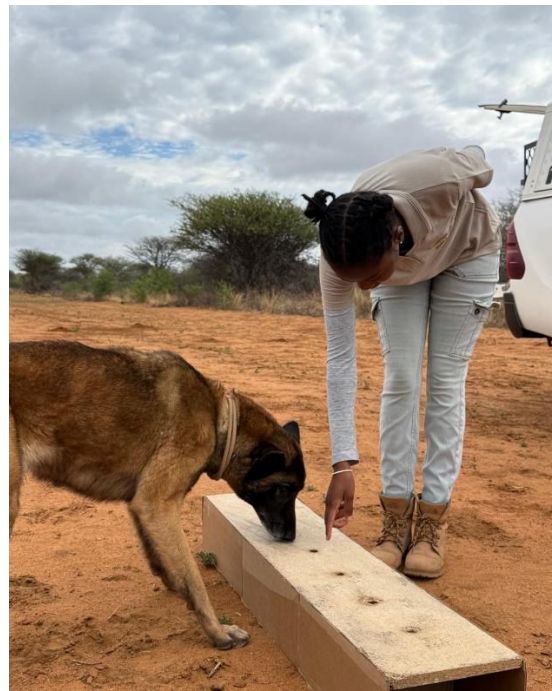
Enyakwa trainiert mit dem neuen Hilfsmittel.

Kürzlich haben unsere Kollegen vom CCF ein neues Schulungsprogramm für Lehrkräfte in Namibia gestartet, um ihnen zu vermitteln, wie sie dank eines speziellen Leitfadens über die Rolle von Raubtieren für das Ökosystem, Umweltbildung besser in den Unterricht integrieren können. Neben dem Leitfaden helfen auch von der AGA entworfene und finanzierte Banner diese wichtigen Inhalte anschaulich darzustellen. Die ersten Fortbildungsveranstaltungen waren ein großer Erfolg und die Lehrkräfte äußerst dankbar und begeistert.