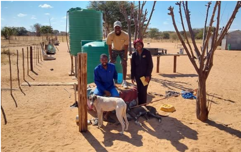
Im Kampf gegen Tollwut besucht das Team auch entlegene Gebiete.

Bevölkerung bekommt die Möglichkeit, Hunde kostenfrei kastrieren zu lassen, um weitere unkontrollierte Vermehrung einzudämmen und im Gegenzug werden bereits geborene Welpen in das Programm aufgenommen, wo sie gut sozialisiert im besten Fall später als Herdenschutzhunde eingesetzt werden können.